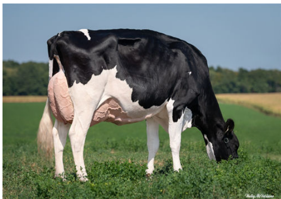
PROGENESIS HIGHJUMP LEADER DAM