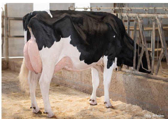
PROGENESIS HIGHJUMP LEADER DAM